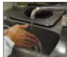
処理後は十分にうがいと手洗いをし、換気をして下さい