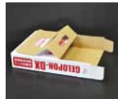
外箱でチリ取りを組み立てる