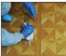
拭き取った後はきれいに水拭きをします

床に除菌剤をかけて浸し、しばらくしてから汚染場所を広げないようペーパータオルで拭き取ります