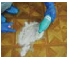
静かに除菌剤をかけます

嘔吐物は広がらない様、凝固剤を外側から円を描くように中心に向けてまんべんなく振りかけます