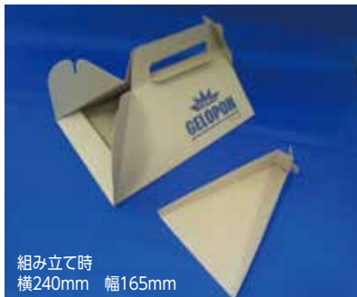
組み立て時 横240mm 幅165mm