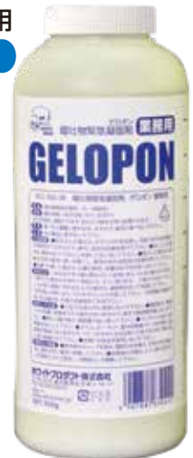
嘔吐物凝固剤 950g φ95×240(h)